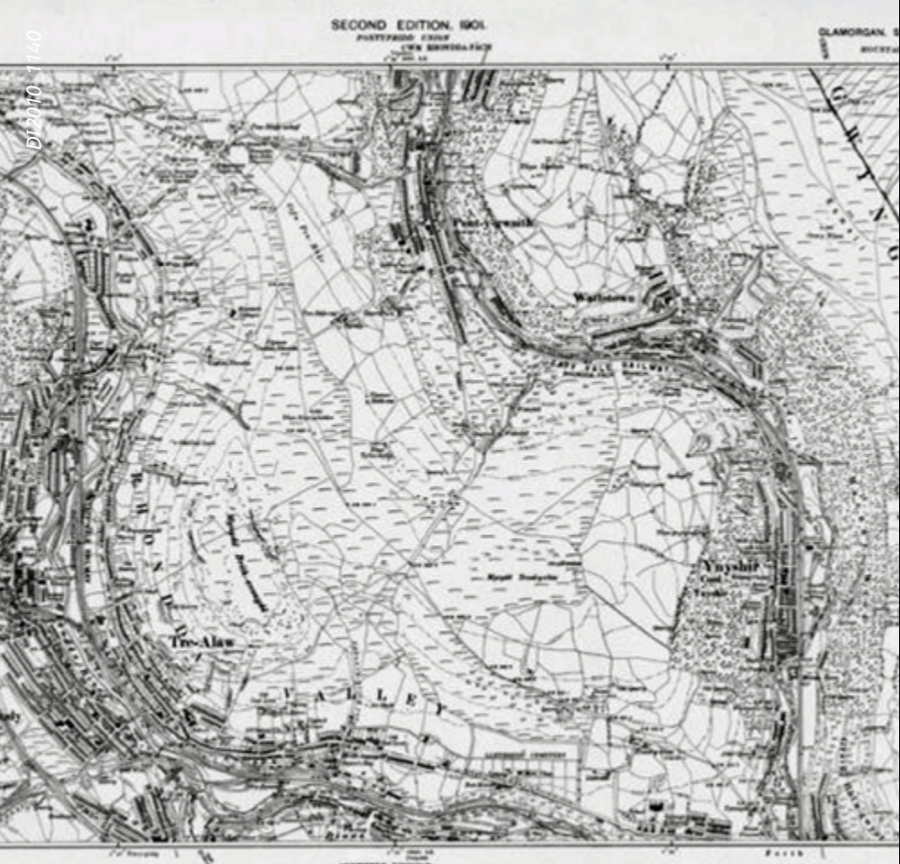
Map Arolwg Ordnans 6", ail argraffiad, dalen Sir Forgannwg XXVII NE (1901), Cwm Rhondda.