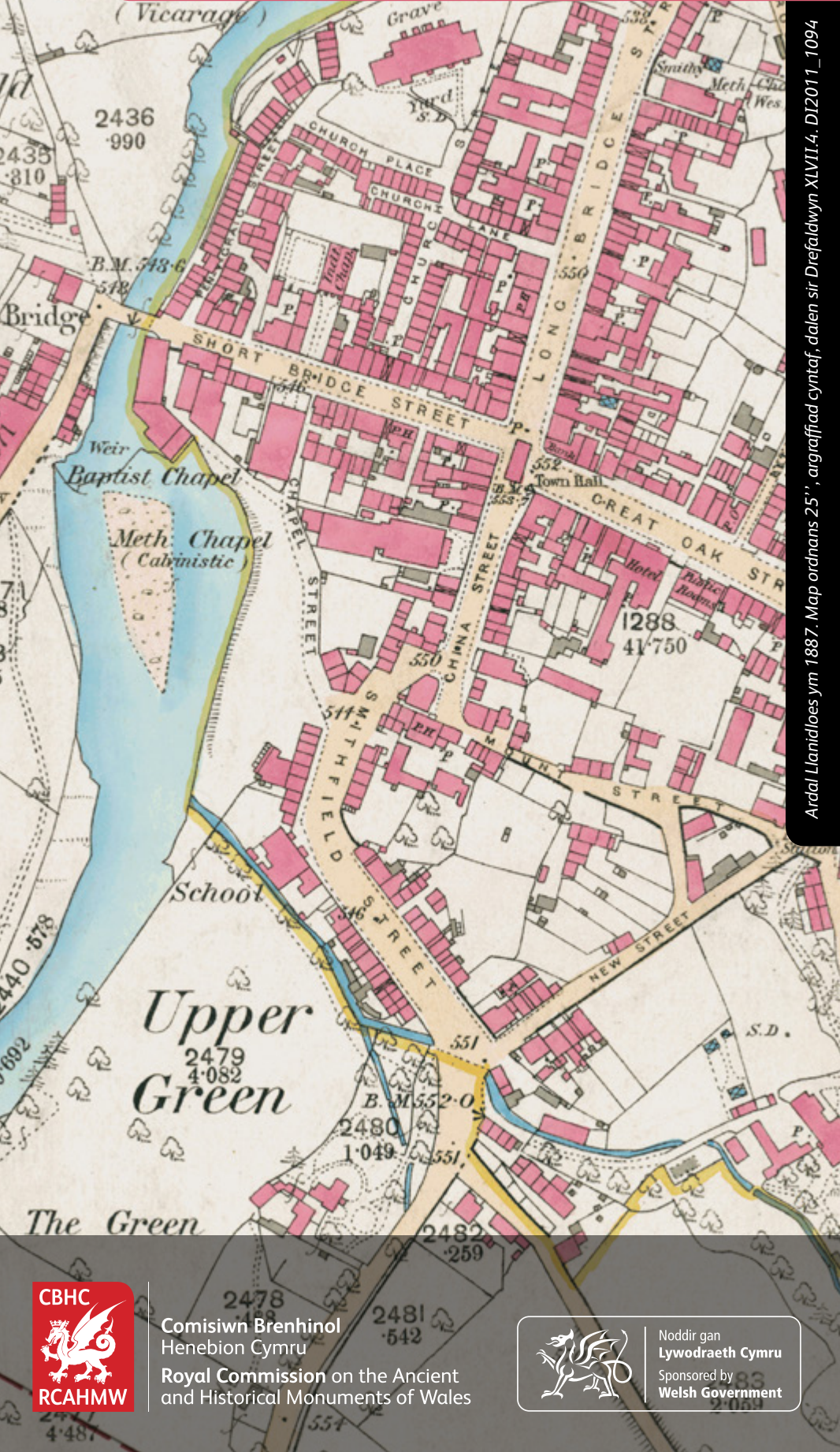
Ardal Llanidloes ym 1887. Map ordnans 25", argraffiad cyntaf, daten sir Drefaiddwyn XVII.4. DI2011_1094