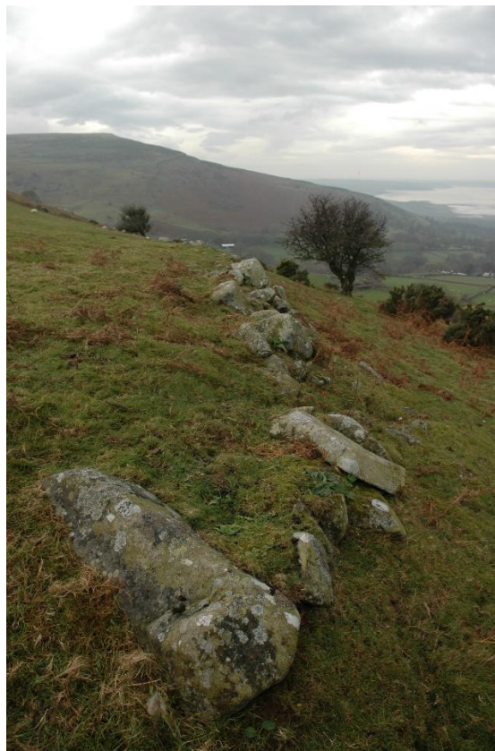
Llun 2.

Cynhaliwyd arolwg lidar cydraniad uchel, wedi'i ariannu gan Lywodraeth Cymru a'r Gronfa Dreftadaeth, i gefnogi'r gweithgareddau hyn. Trafodir ei gymwysiadau. Cyflwynir canlyniadau rhagarweiniol mewn cyfuniad ag ymchwil doethurol lidar-seiliedig diweddar a wnaed ar y cyd gan APCE a Phrifysgol Sheffield. Mae hyn wedi tynnu sylw at bwysigrwydd yr aneddiadau a chaeau o'r cyfnodau cynhanesyddol a Rhufeinig ar lethrau'r Carneddau, sydd mewn cyflwr eithriadol o dda. Bydd casglu mwy o wybodaeth am ddisbarthiad, tarddiad a chyflwr caeau hynafol o gymorth i'w rheoli'n well, a bydd modd cymhwyso'r wybodaeth at dirweddau cyffelyb mewn ardaloedd eraill.